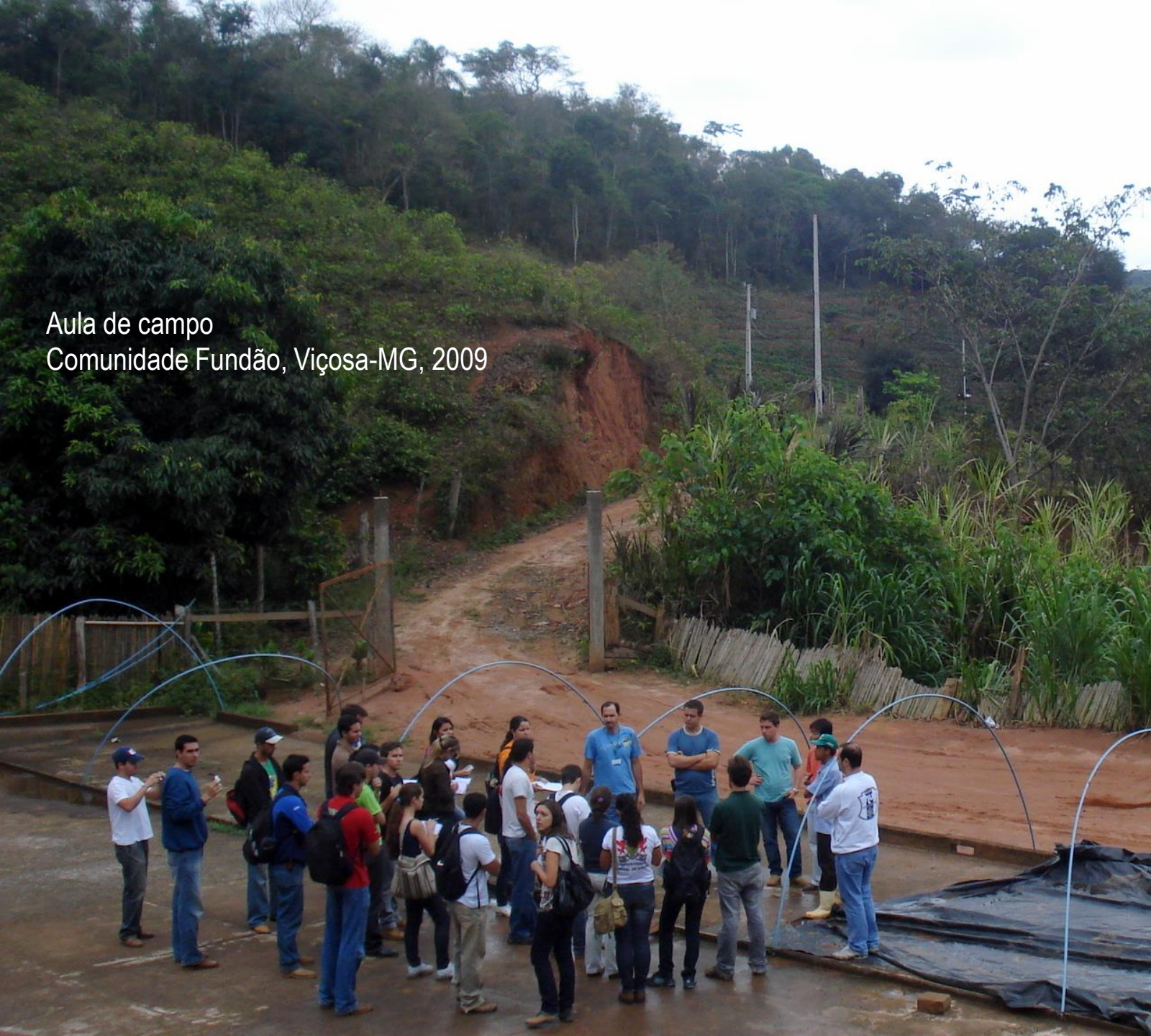
Aula de campo Comunidade Fundão, Viçosa-MG, 2009