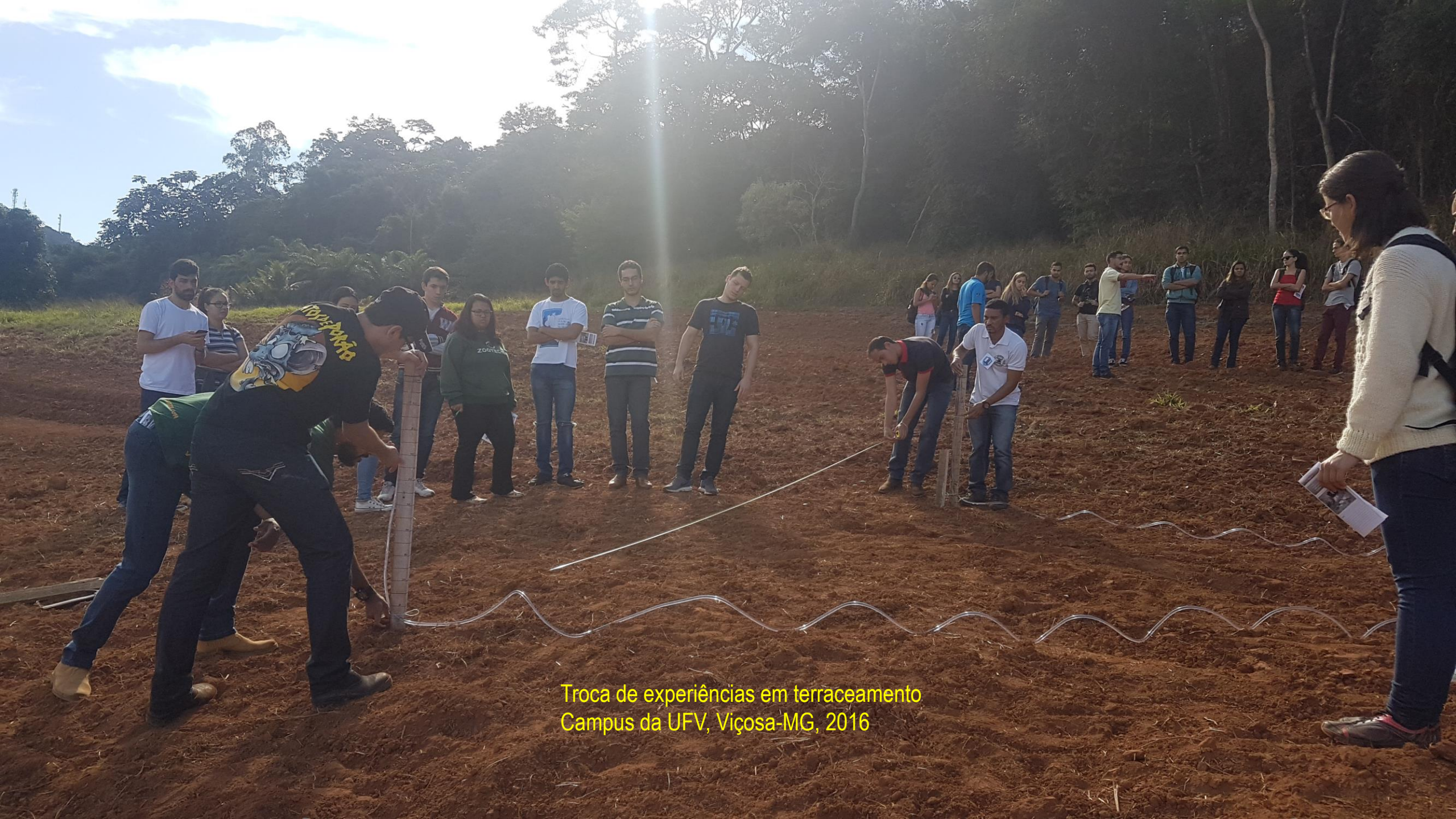
Troca de experiências em terraceamento Campus da UFV, Viçosa-MG, 2016