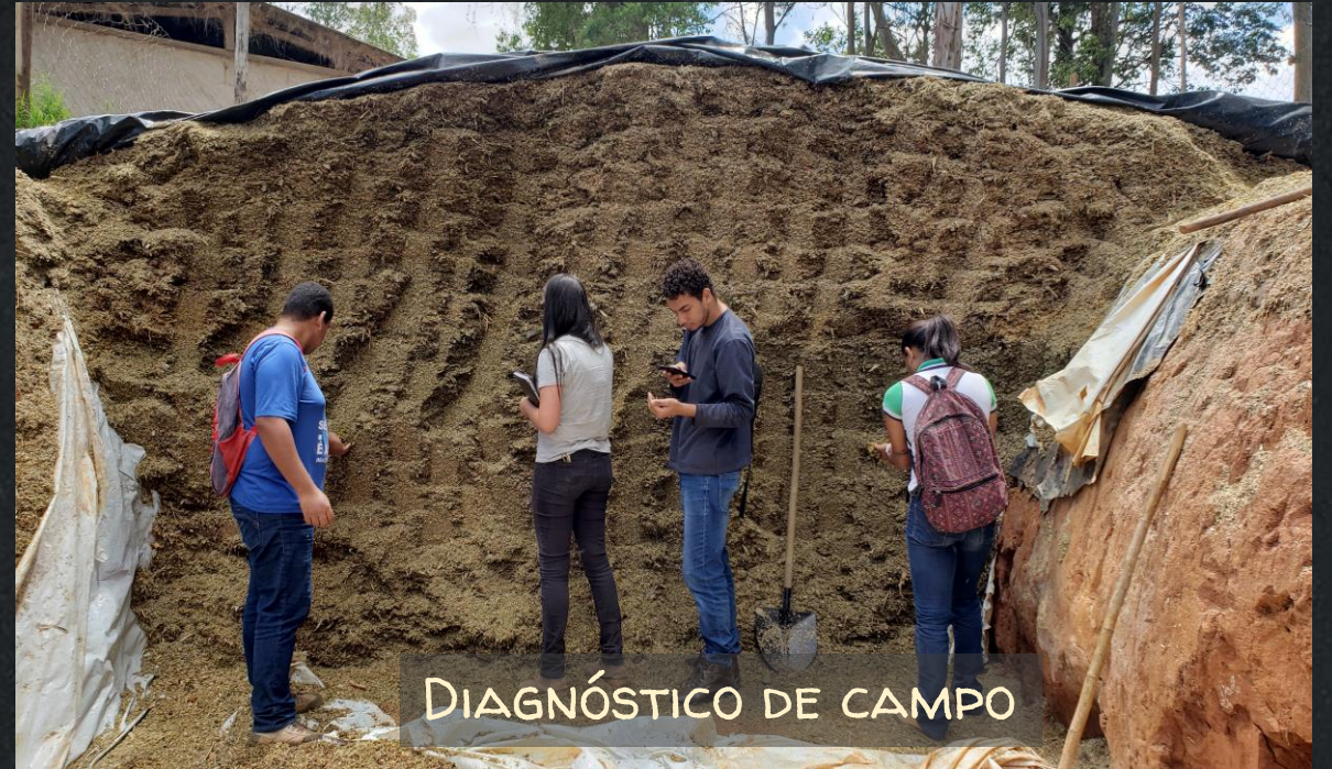
DIAGNÓSTICO DE CAMPO