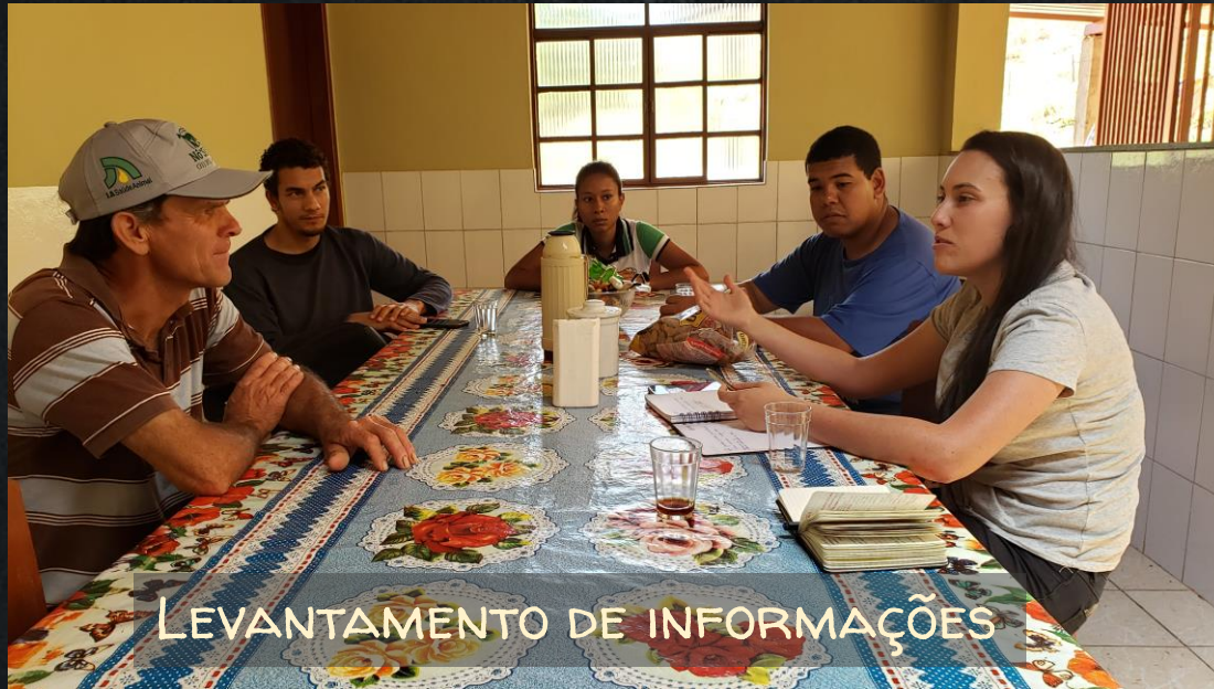
LEVANTAMENTO DE INFORMAÇÕES