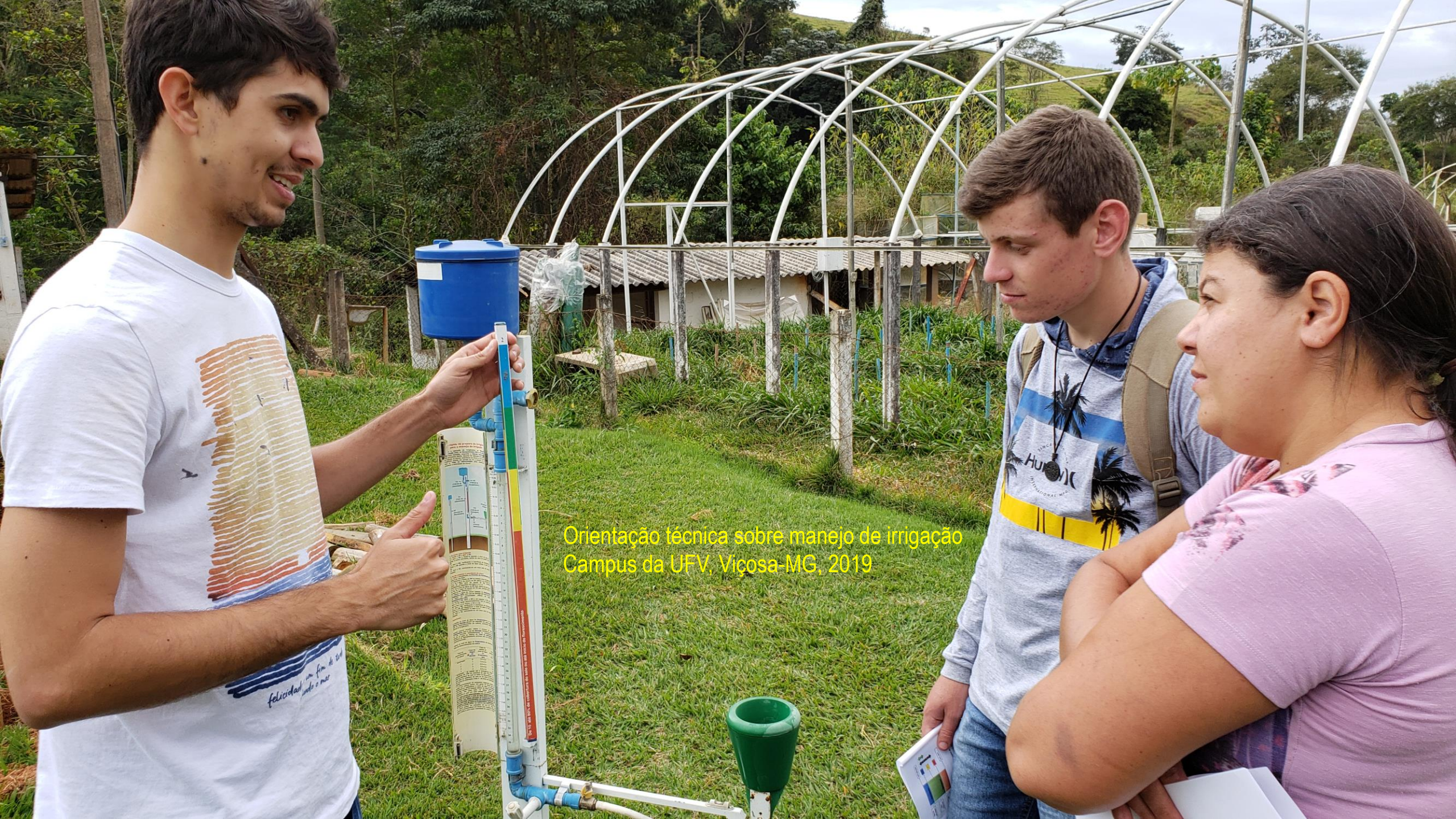
Orientação técnica sobre manejo de irrigação Campus da UFV, Viçosa-MG, 2019