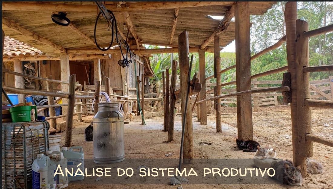
ANÁLISE DO SISTEMA PRODUTIVO